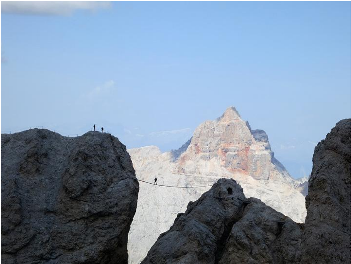
via ferrata Ivo Dibona (Monte Cristallo)