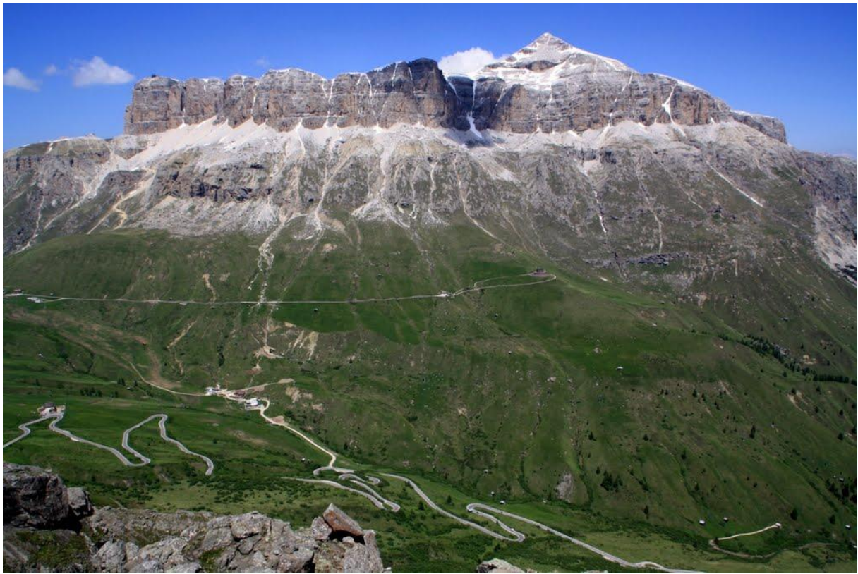
Piz Boé (Gruppo de Sella)