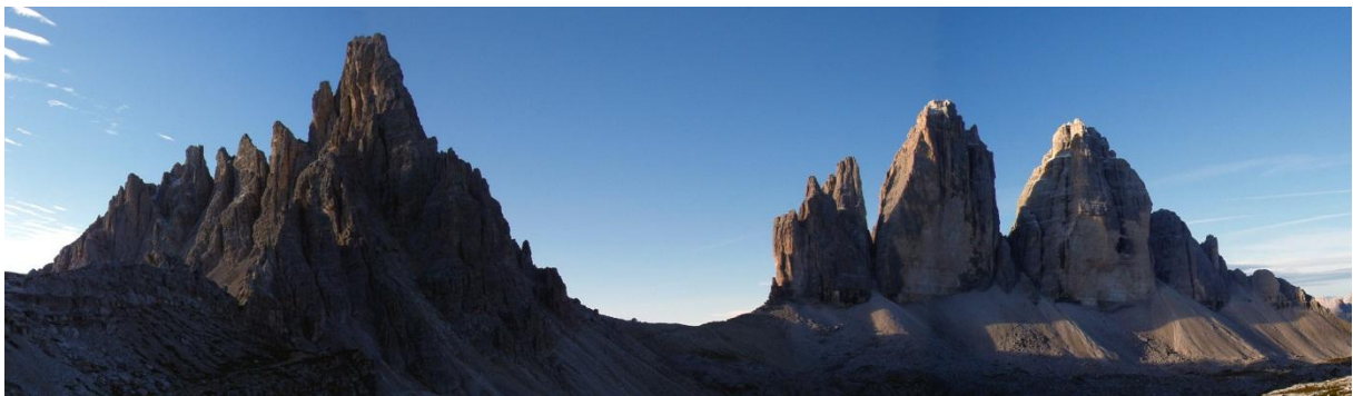
Paternkofel a Tre Cime di Lavaredo