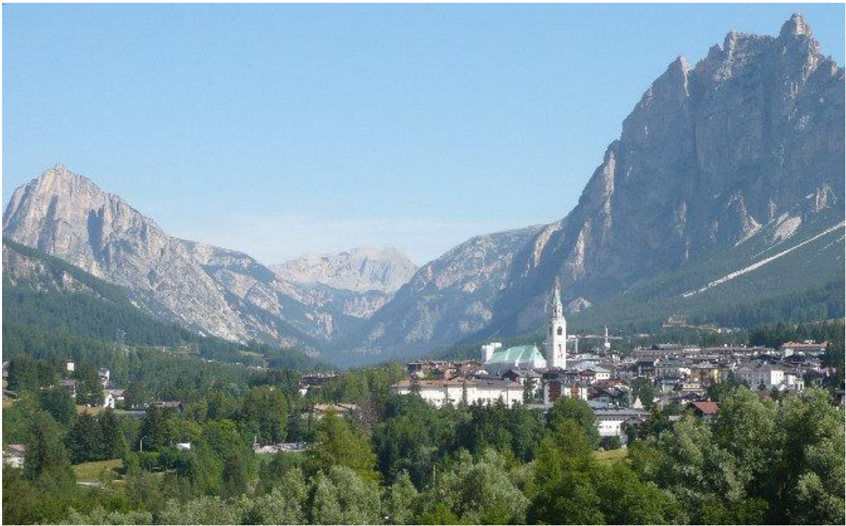
Cortina d' Ampezzo