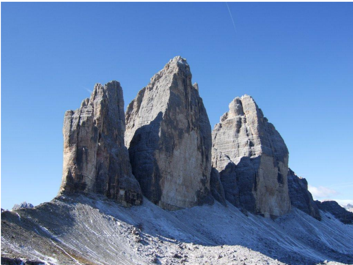
Tre Cime di Lavaredo